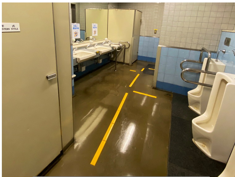
写真：公共トイレにパームラインを貼った例 (横浜ラポール 新横浜)

開発と製造：有限会社テイクス (T9020002010292) 244-0842 横浜市栄区飯島町1579-1 電話 045-890-6898 FAX 045-890-6899 palmsonar.com PL2023p.